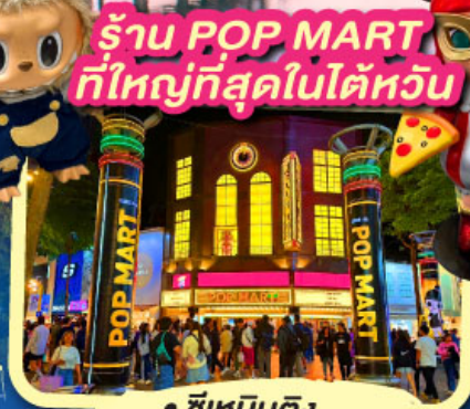
• ซีเหมินดิง