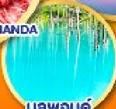
บรูพอนต์ (บ่อน้ำสีฟ้า)