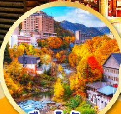
เมืองโจเซ็งเค