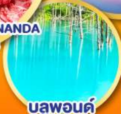
บลูพอนด์ (บ่อน้ำสีฟ้า)

เดินทาง 24-30 ต.ค. 67 30 ต.ค.-06 พ.ย. 67 07-13, 13-19 พ.ย.67