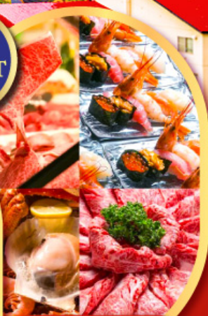
พิเศษ!! บุฟเฟ่ต์ร้าน NANDA ดีที่สุดในซัปโปโร