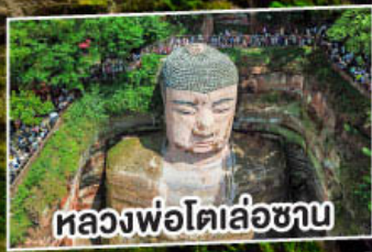
ถ่องฟ้อโตเล่อซาน