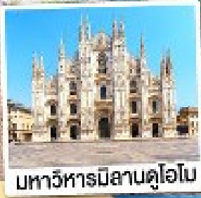
มหาวิหารมิลานดูโอโม