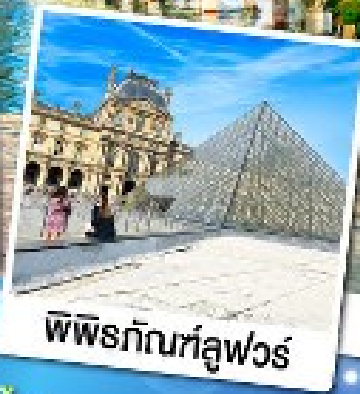
พีระกัมที่ลูฟวร์