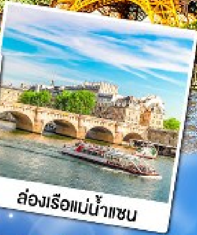
ส่องเรือแม่น้ำแซน