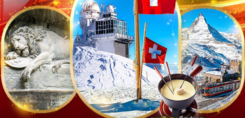
เมนูพิเศษ ชีสฟองดู