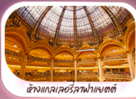
ห้างแลคซัวร์ลาฟาแยตต์