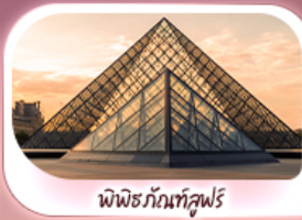
พิพิธภัณฑ์ลูฟร์