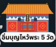
อิมบุนยไหว้พระ 5 วัด