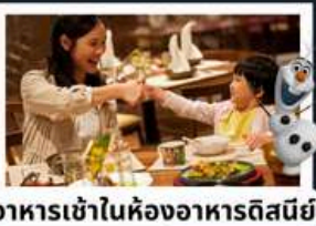
อาหารเข้าในห้องพักอาหารดิสนีย์