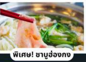
พิเศษ! ชาบูฮ่องกง

พักรูในดิสนีย์แลนด์ 1 คืน พร้อมบัตรเครื่องเล่นแบบจุใจ