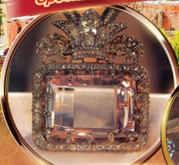
NATIONAL JEWELRY MUSEUM