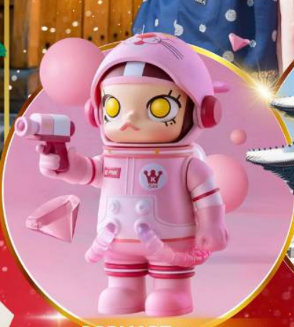
POP MART ฮงแด