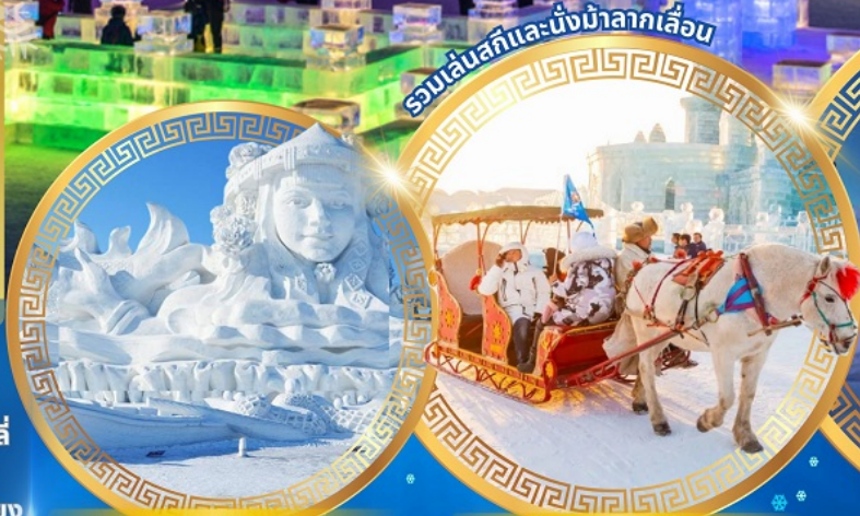
เกาะพระอาทิตย์ นั่งรถม้าลากเลื่อน หมู่บ้านหิมะ

จตุรัสโบสถ์เซินโซเฟีย ถนนจงยง หมู่บ้านหิมะดินแดนมหัศจรรย์ อนุสาวรีย์ผึ้งหง สนุกสนานกับลานสกียาปูลี ถนนเสี่ยุ่นเจีย เขาแกะหลัว เขาป้างฉุย ภาพเขียน Ice and Snow แม่น้ำซงฮัวเจียง โซ่วว้ยน้ำแข็ง เกาะพระอาทิตย์