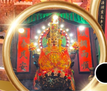
ขอพรซื้อขายอสังหาริมทรัพย์