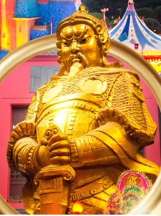
วัดเขกงหนิว

• ดิสนีย์แลนด์ (เต็มวัน) • วัดเขกงหนิว • อ่าวรีพัลส์เบย์