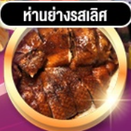
ห่านย่างรสเลิศ