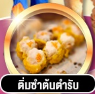
ติ่มซำต้นตำรับ