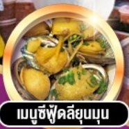
เมนูซีฟู้ดลิ้นมูน