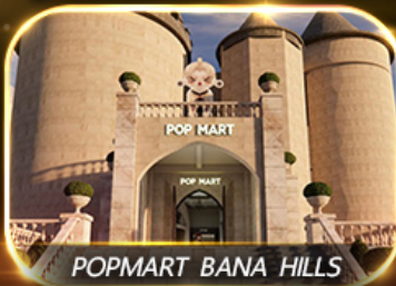
POP MART BANA HILLS

สัมผัสความงามหมู่บ้านฝรั่งเศสที่บานาฮิลล์ ช้อปปิ้ง POPMART