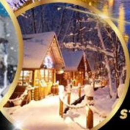
หมู่บ้านเทปนิยาย นิงเกิลเทอรัส