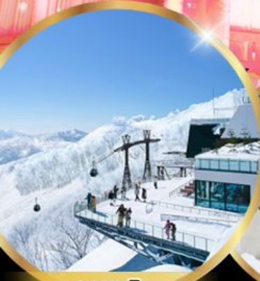
จุดชมวิว Unkai Terrace