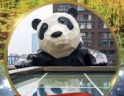
แพนด้ายักษ์

มหัศจรรย์ความงาม อุทยานจิวจ้ายโกว (รวมรถเหมาเที่ยวอุทยานเต็มวัน) ชมอุทยานหวงหลง (รวมกระเช้า) • สี่ฤดู • อุทยานของเขี้ยวโกว (รวมรถอุทยาน) เมืองเก่าชงฟาน • ถนนคนเดินจิมหลี่ + ไถ่ตู้หลี่ • ชมแพนด้ายักษ์ป็นตึก