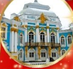
พระราชวังแคเทอรีน