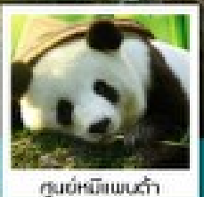
ศูนย์อนุรักษ์แพนด้า