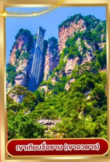
เขาเทียนจื่อซาน (เขาวงตาร)