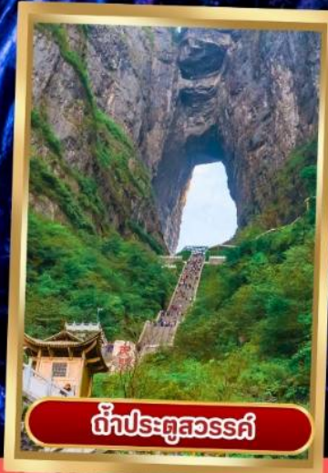
กำแพงประตูสวรรค์

📍 เซ้ออินไฮโลก์สุดฮิต 🕒 น้่านักกระเป่า 20 Kg 🏨 พักโรงแรม 4 ดาว