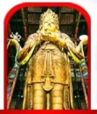
วัดกานดา