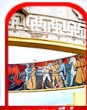
อนุสาวรีย์ โซซาน