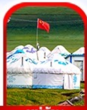
หมู่บ้าน พื้นเมือง