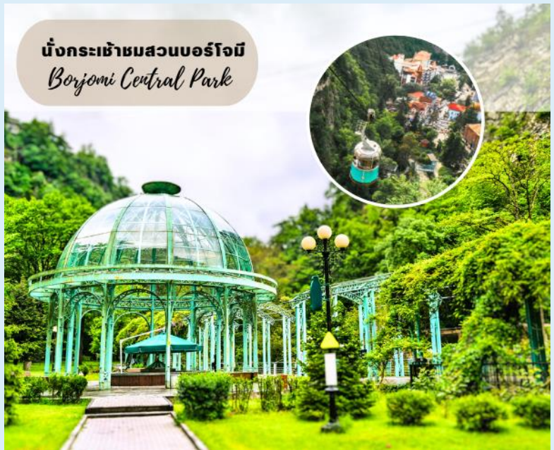
นั่งกระเช้าชมสวนบอร์โจมี Borjomi Central Park

โดยการแช่น้ำแร่ในวันหยุด จากนั้นนำท่านนั่งกระเช้าสู่จุดชมวิวบนหน้าผาเหนือสวนบอร์โจมี