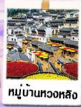
หมู่บ้านหวงหลิง