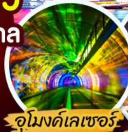
อุโมงค์เคเซอร์