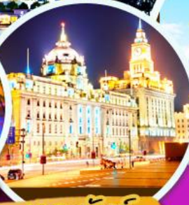
เดอะมอลล์