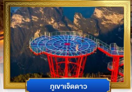
ภูเขาเจ็ดดาว