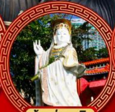
เจ้าแม่กวนอิม รaffles เบย์