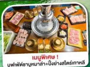
เมนูพิเศษ! บุฟเฟ่ต์ชาบูหม่าล่า+บิงย่างสโตรเกาหลี่