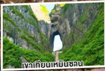
เงาเทียนเหมินชว่น