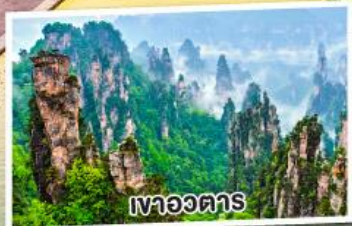
เขาวงตาร