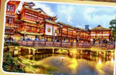
ตลาดร้อยปีเจิ้งหวังเมี่ยว