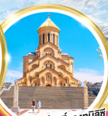
วิหารศักดิ์สิทธิ์ของทบิลีซี