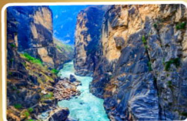
ช่องแคบเล็กระโจน