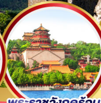
พระราชวังฤดูร้อน อิ๋หุ่ยฮวน