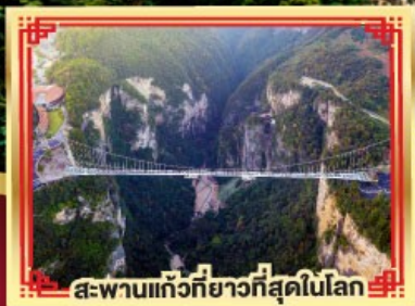
สะพานแกว้ที่ยาวที่สุดในโลก

เขาวงกต เกียนเหมินซาน สองเมืองโบราณ ฟูหลงจั้น เฟิ่งหวง