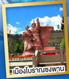
เมืองโบราณชงพาน