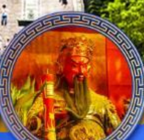
วัดกวนโถ