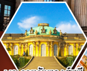
พระราชวังชองส์ซูซี