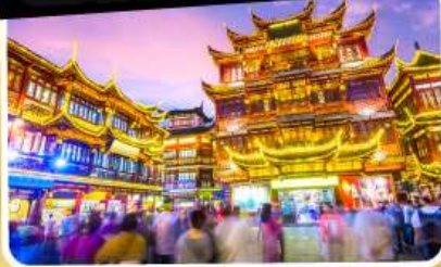
ตลาดร้อยปีเจิ้งหวังเหมียว