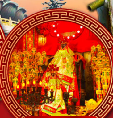
วัดเจ้าแม่กวนอิม ฮ่องกง