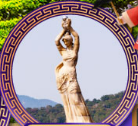
จูไห่พิงเซอร์กิส