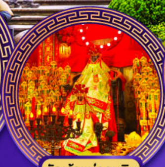
วัดเจ้าแม่กวนอิม ฮองฮ่า