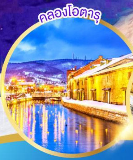
คลองโอตารุ