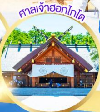
ศาลเจ้าฮอกไกโด