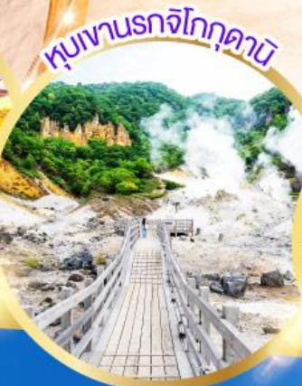
หุบเขานรกจิกุกุดามิ