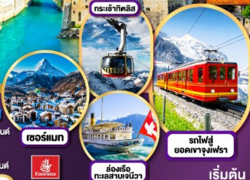
กระเช้ากิตติส