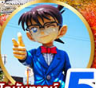
โคนันทาวน์