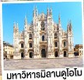
มหาวิหารมิลานดูโอโม

เมนูพิเศษ! หอยเอสคาโก้ อาหารไทย, พังคูนีส