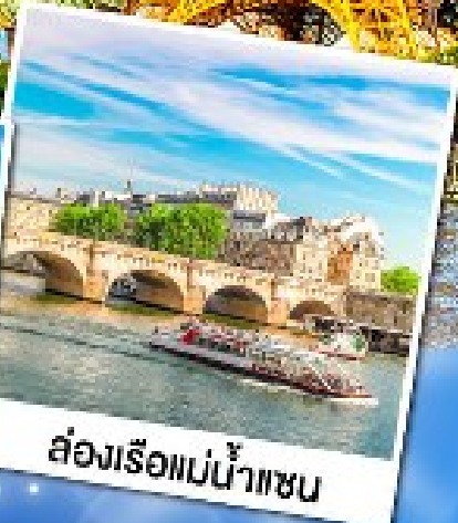
ส่องเรือแม่น้ำแซน

23-29 ก.ย. 67 07-13, 21-27 ต.ค. 67 04-10, 18-24 พ.ย. 67 02-08 ธ.ค. 67