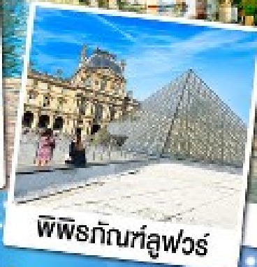
พีระมิดที่ลูฟวร์