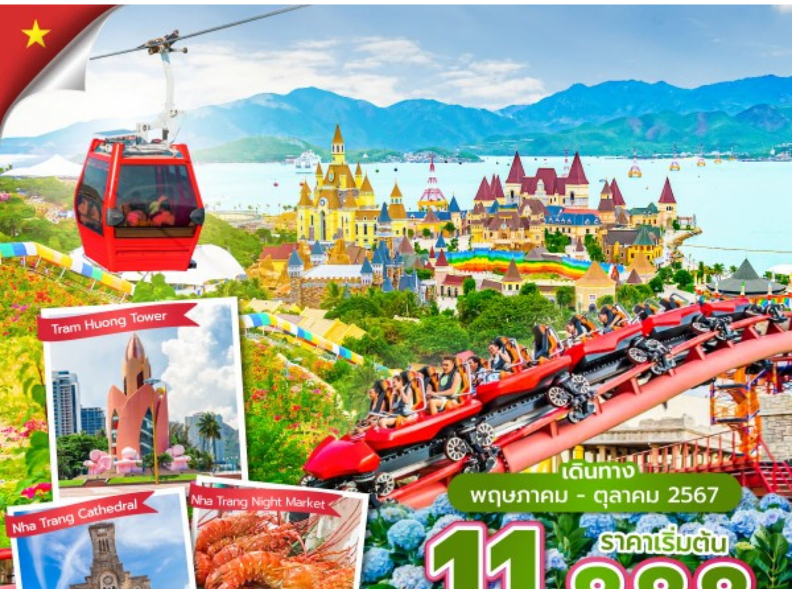
Tram Huong Tower