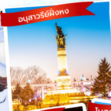
อนุสาวรีย์ตี่งหง