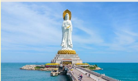
เจ้าแม่กวนอิมหนานชาน