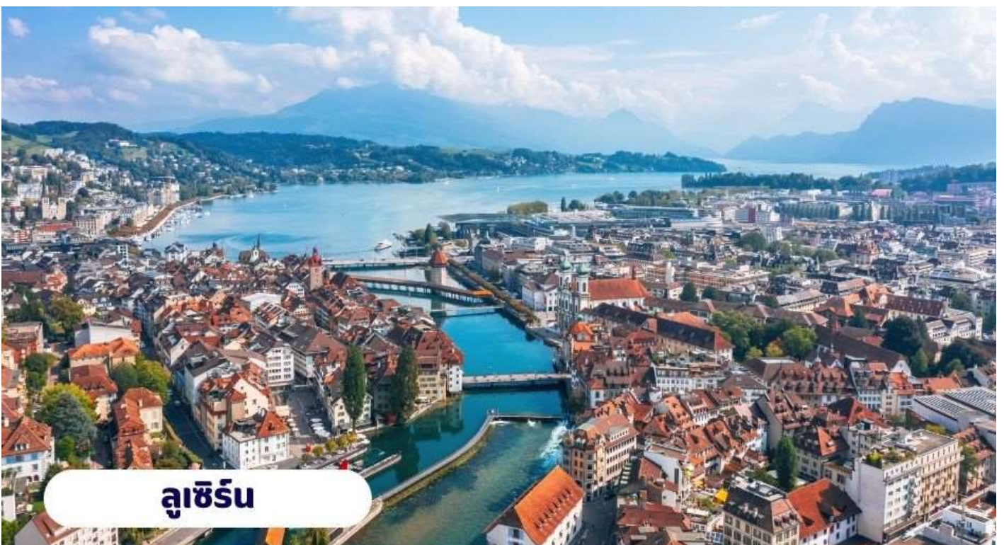
ลูเซิร์น