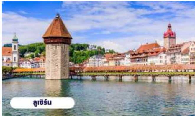
ลูเซิร์น

🕒 บริการอาหารกลางวัน ณ ภัตตาคาร จากนั้นนำท่านเดินทางสู่ เมืองลูเซิร์น ใช้เวลาเดินทางประมาณ 1 ชั่วโมง อดีตหัวเมืองโบราณของสวิสเซอร์แลนด์ เป็นดินแดนที่ได้รับสมญานามว่า หลังคาแห่งทวีปยุโรป (The roof of Europe) เพราะนอกจากจะมีเทือกเขาสูงเสียดฟ้าอย่างเทือกเขาแอลป์แล้ว ก็ยังมีภูเขาใหญ่น้อยสลับกับป่าไม้ที่แทรกตัวอยู่ตามเนินเขาและไหล่เขา สลับแซมด้วยดงดอกไม้ป่าและทุ่งหญ้าอันเขียวชอุ่ม จากนั้นนำท่านชมและแวะถ่ายรูปกับ สะพานไม้ชาเปล หรือสะพานวิหาร (Chapel bridge) ซึ่งข้ามแม่น้ำรอยซ์ เป็นสะพานไม้ที่เก่าแก่ที่สุดในโลก มีอายุหลายร้อยปี เป็นสัญลักษณ์และ