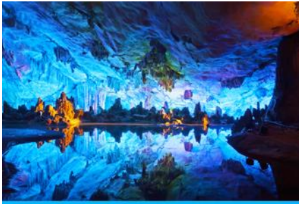
ถ้ำขลุ่ยอ้อ