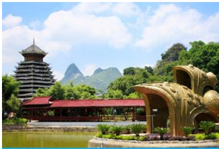
สวนหลิวซานเจีย