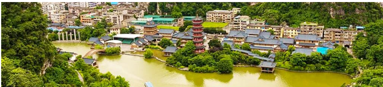
กุ้ยหลิน