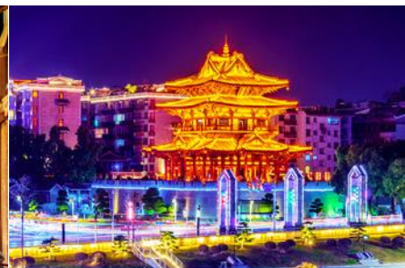
หอชิวเหย้าไหลว