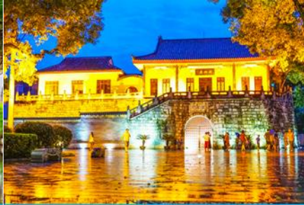
ประตูเมืองโบราณกุหนานเหมิน