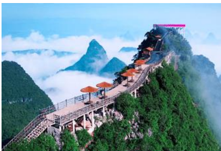
น้ำกระเช้าชั้นเขาหญู่ฝง

พักที่ YANGSHUO ELITE HOTEL ระดับ 4 ดาวท้องถิ่นหรือเทียบเท่าใน เมืองหยางชัว