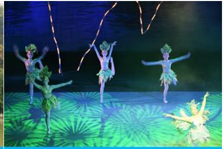
โชว์ DREAM LIKE LIJIANG