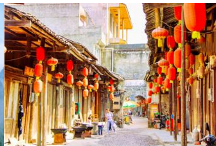
เมืองโบราณต้าชวี