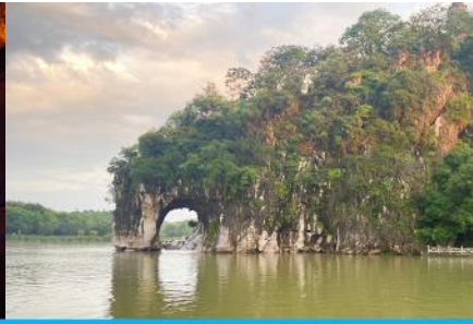
เขาวงช้าง