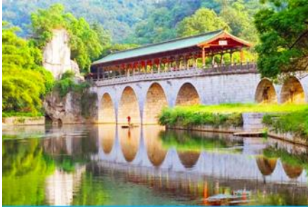
สวนเจ็ดดาว