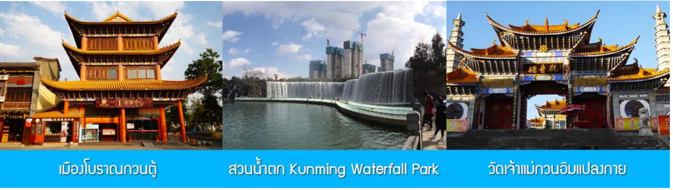
เมิวโบริลกวณตุ สวนน้ำตก Kunming Waterfall Park วัดเจ้าแม่กวณอิมเปलगาย

พักที่ REGENT HOTEL ระดับ 4 ดาว หรือเทียบเท่าในเมืองต้าหลี่