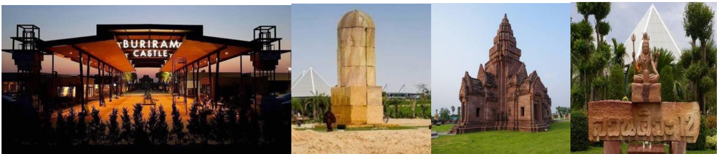
พักที่(N1) โรงแรม r2 (จ.บุรีรัมย์) หรือเทียบเท่า

18.00 น. รับประทานอาหารค่ำอิสระ ที่ BURIRAM CASTLE เป็นส่วนหนึ่งของ BURIRAM UNITED ตั้งอยู่ระหว่างสนาม Chang ARENA และสนามแข่งรถระดับโลก CHANG INTERNATIONAL CIRCUIT พื้นที่ขนาด 93,000 ตร.ม. แบ่งเป็น Avenue Area 35,000 ตร.ม. ,ปราสาทหินพนมรุ้งจำลอง 14,000 ตร.ม., สวนไม้ดอก ไม้ประดับ และสวนตะบองเพชร 35,000 ตร.ม. (ออกแบบและจัดสร้างโดย สวนนงนุช), CAR PARKING 8,000 ตร.ม. เป็นแหล่งอารยธรรมใหม่...ที่รวมหัวใจของบุรีรัมย์ไว้..ที่นี่ ที่เดียว ที่รวมความต้องการให้กับทุกคนได้ไม่ว่าจะเป็นชาวบุรีรัมย์ เพื่อนพี่น้องจากจังหวัดใกล้เคียง นักท่องเที่ยวทั้งไทยและต่างชาติ ที่นี่...ผसान โลก 2 ยุค ได้อย่างลงตัวที่สุด ความงดงามของอารยธรรมขอมในอดีต ผสานเป็นหนึ่งเดียวกับโลกไลฟ์สไตล์คนรุ่นใหม่ด้วย มาตรฐานที่เป็นสากล เปิดบริการ ปี 2558 (ต้นไตรมาส 3 ) มีปราสาทพนมรุ้งจำลอง เป็นจุด landmark และมีสวนหินและสวนตะบองเพชรขนาดใหญ่ ชม มหาศิวลึงค์ ที่ใหญ่ที่สุดในโลก “มหาศิวลึงค์” ตั้งอยู่ภายในสวน “สวนศิวะ 12” โดย มหาศิวลึงค์ ทำจากหินทราย สูงกว่า 9 เมตร ซึ่งใหญ่ที่สุดในโลก รายรอบด้วยแผ่นศิลาหินทราย “กามาสูตร” ซึ่งเปรียบดั่งจุดกำเนิดแห่งจักรวาล