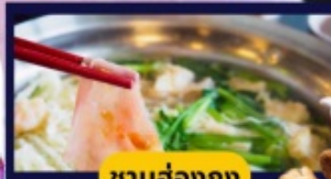
ชาบูฮ่องกง

🍴 อาหาร 6 มื้อ พิเศษ! อาหารเข้าในห้องพักอาหารดิสนีย์