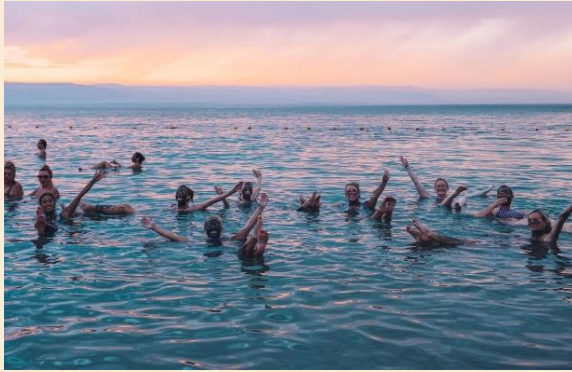
ท่านพักผ่อนตามอัธยาศัย

นำท่านเดินทางสู่ ทะเลสาบเดดซี (Dead Sea) (ใช้เวลาเดินทางประมาณ 45 นาที) หรือที่เรียกกันว่า ทะเลมรณะ อีกสมญานามหนึ่งว่าเป็น "ทะเลที่ไม่มีวันจมน้ำ" ตั้งอยู่ตรงเขตแดนประเทศจอร์แดนและอิสราเอล เป็นจุดที่ต่ำที่สุดในโลก มีความต่ำกว่าระดับน้ำทะเลถึง 400 เมตร และมีความเค็มที่สุดในโลกมากกว่า 20% ของน้ำทะเลทั่วไป ทำให้ไม่มีสิ่งมีชีวิตใดเลยอาศัยอยู่ได้ในท้องทะเลแห่งนี้ ความเข้มข้นของเกลือละลายอยู่สูงทำให้คนสามารถไปลอยน้ำในเดดซีได้ นำท่านเดินทางสู่โรงแรมที่พัก โรงแรมตั้งอยู่ริมทะเลสาบเดดซี ให้ท่านได้สนุกกับการพอกโคลน เพื่อบำรุงผิวพรรณ ให้นุ่มเนียน และเพลิดเพลินกับการลอยตัวในทะเลเดดซี เพื่อสุขภาพผิวพรรณที่ดี อิสระให้