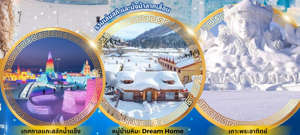
เทศกาลแกะสลักน้ำแข็ง

จตุรัสโบสถ์เซินโซเฟีย ถนนจงยาง หมู่บ้านหิมะดินแดนมหัศจรรย์ อนุสาวรีย์ฝั่งหง สนุกสนานกับลานสกียาปูลี่ ถนนแช่ย์เจีย เขาแกะหลัว เขาปังจวู ภาพเขียน Ice and Snow แม่น้ำซงฮัวเจียง โซ่วว้ายน้ำแข็ง เกาะพระอาทิตย์